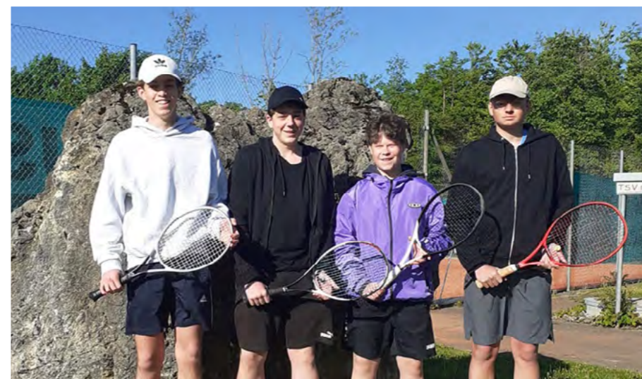
Sommer 2025: Aufstieg der U18 Junioren in die Kreisstaffel 1