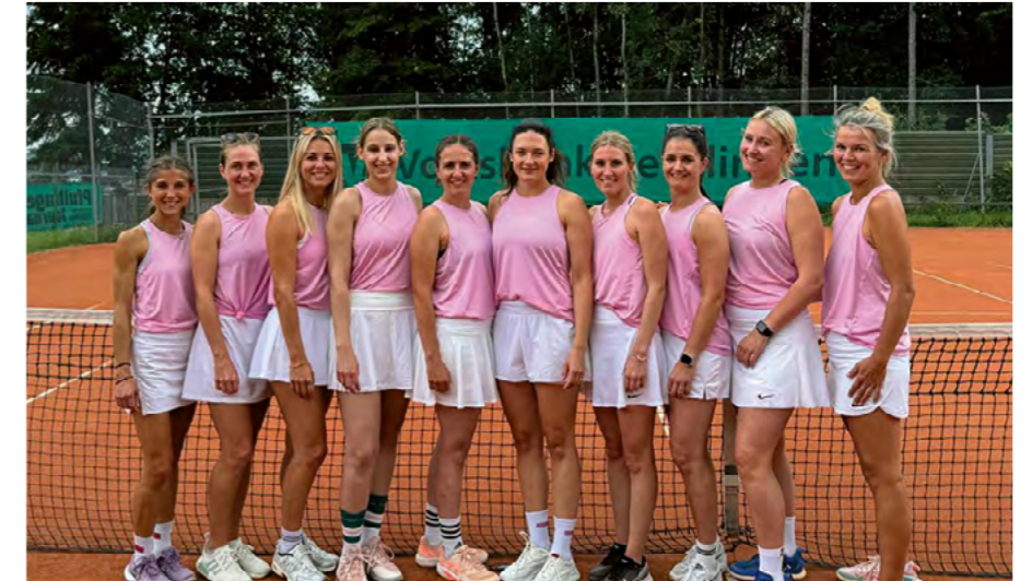
Winter 2025/2026: Aufstieg der Damen in die Bezirksstaffel 1