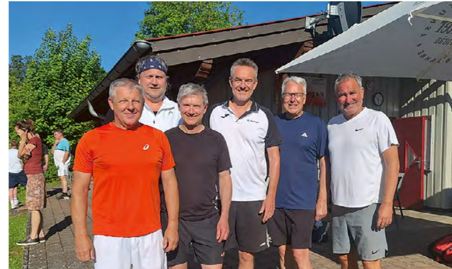
Sommer 2025 Aufstieg der Herren 55 in die Württembergliga